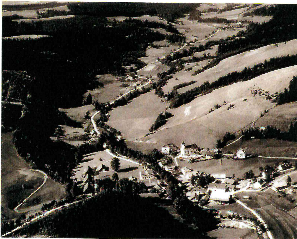
Kreuzthal-Eisenbach um 1930 (Luftbild)

Dieses Buch ist selbst vielen Allgäuern noch unbekannt.