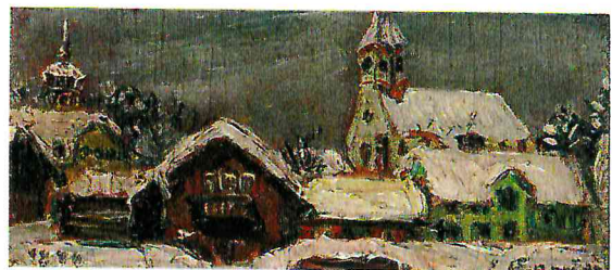
Schnee in Kreuzthal-Eisenbach, Öl/Sperrholz 1944; 6,5 x, 14 cm, WV Nr. 182 (für die Puppengalerie)

Auf Einladung des algerischen Staatspräsidenten Abdelaziz Bouteflika nahm Bettina Heinen-Ayech an einem offiziellen Empfang anlässlich des algerischen Nationalfeiertages am 1. 11. 2010 in Algier teil.