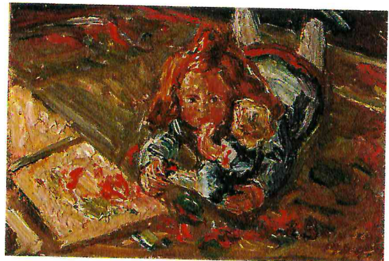
Bettina mit Puppe, Öl / Preßholz 1944; 8,8 x 13 cm, WV Nr. 187 (für die Puppengalerie)

Erst im Herbst 1945 gaben wir unser verstecktes Domizil in Kreuzthal auf und kehrten in das Solinger Haus zurück.