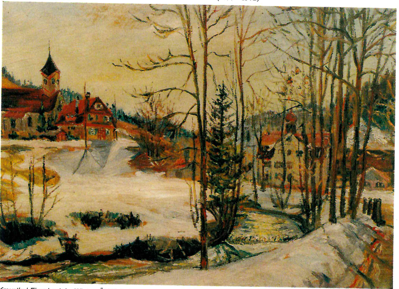
Kreuzthal-Eisenbach im Winter, Öl / Holzplatte 1944; 43,5 x 57,3 cm, WV Nr. 173