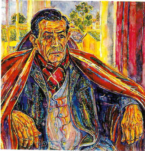
Bettina Heinen-Ayech: Abdelhamid Ayech, Aquarell 1992, 57 x 77 cm (Ausschnitt)