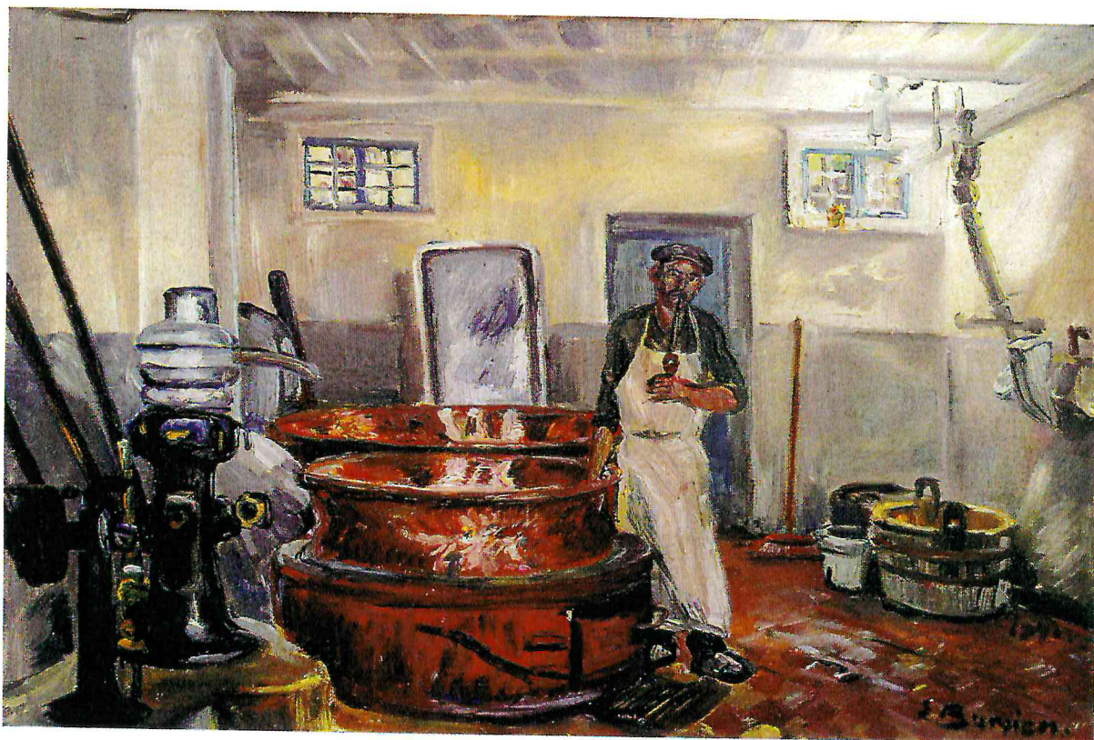
„Käserei Kohle in Kreuzthal“, Öl / Leinwand 1941; 43,5 x 65,5 cm, WV Nr. 135