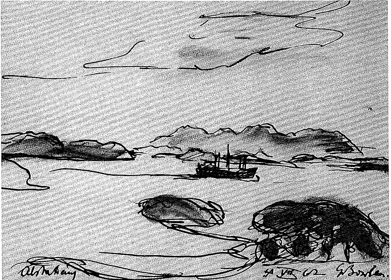
Erwin Bowien: Alstahaug auf Alsten in Nord-Norwegen

Tusche-Zeichnung aus dem Jahre 1962. Hierzu Schilderungen von Erwin Bowien ab Seite 3 dieser »Mitteilungen«.