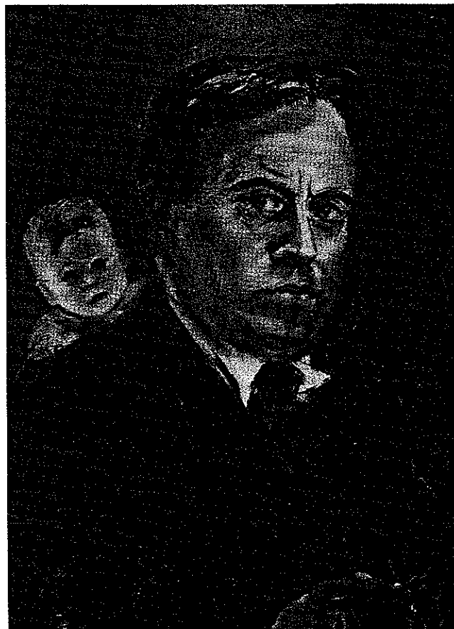
Erwin Bowien: Selbstbildnis, Pastell 1935

Doch immer wieder wurde ihm vor allem auch die Schweiz zweite Heimat. Hier hatte er schon in frühester Jugend eine Ausstellung, auch nach dem Krieg wurde er verschiedentlich mit beachtlichem Erfolg in der Schweiz ausgestellt. In Solingen ist noch eine Ausstellung im Klingenmuseum (1960 zu Bowiens 60. Geburtstag) in guter Erinnerung. Erwin Bowien ist nach dem Krieg nicht den Weg mit den Modernen gegangen. Er tat gut daran, seine vielen Freunde weiterhin mit einer Malerei zu erfreuen, die die Schönheit sucht und sie aus eminenter malerischer Begabung heraus zu bannen weiß. Sein rastloses Suchen nach der intensiven graphischen Form, die Präzision seines Striches und der Schwung seiner Phantasie schufen daneben ein graphisches Werk, das jedoch Diener der Malerei bleiben will. Dadurch wurde Bowien Meister in einer heute verkannten Technik: Im Pastell. Im Pastell gelangen ihm vor allem atmosphärische Portraits und Kinderbildnisse von Meisterschaft. Wir wünschen Erwin Bowien viel Erfolg bei seiner Pariser Ausstellung. Kurz vorher stellte seine Schülerin Bettina in der gleichen Galerie aus.