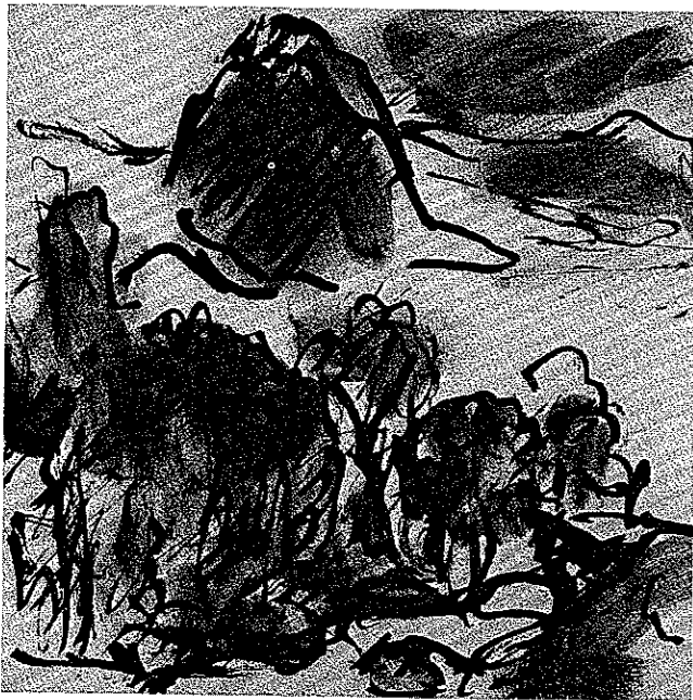
Erwin Bowien: Auf der Insel Alsten, Ausschnitt, Tusche 1962